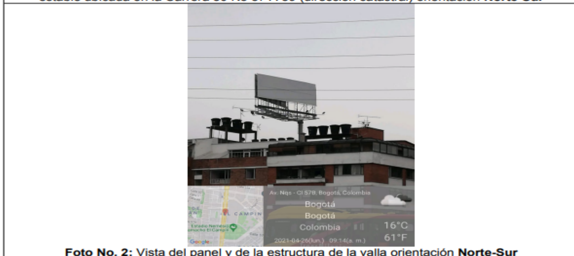
Foto No. 2: Vista del panel y de la estructura de la valla orientación Norte-Sur