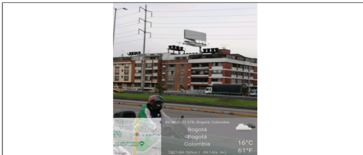
Foto No. 1: Vista panorámica del predio y de la estructura de la valla en buenas condiciones y estable ubicada en la Carrera 30 No 57 A 39 (dirección catastral) orientación Norte-Sur